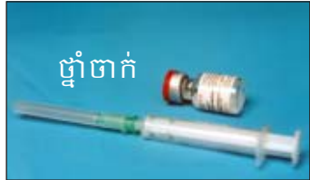
ថ្នាំចាក់