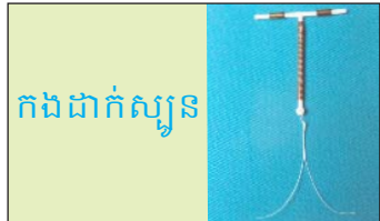
កងដាក់ស្បូន