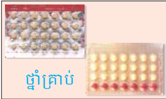
ថ្នាំគ្រាប់