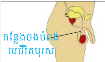
កន្លែងចងបំណង មេជីវិតបុរស