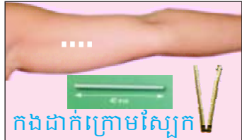
កងដាក់ក្រោមស្បែក