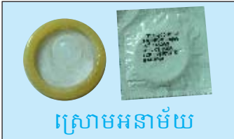
ស្រោមអនាម័យ