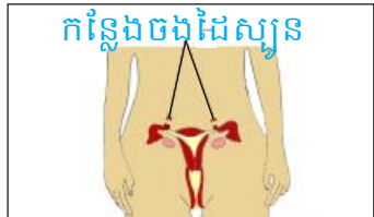
កន្លែងចងដៃស្បូន

ពិភាក្សាជាមួយគ្រូពេទ្យនៅគ្លីនិក “រ៉ាក់” ដើម្បីជ្រើសរើសមធ្យោបាយសមស្របសម្រាប់អ្នក ។