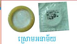
ស្រោមអនាម័យ

ក្រោយពេលវះចង គូស្វាមីភរិយាត្រូវប្រើស្រោមអនាម័យ ឬមធ្យោបាយពន្យារកំណើតដទៃទៀតចំនួន៣ខែ ។