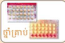
ថ្នាំគ្រាប់