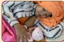
បំបៅដោះកូនសុទ្ធ