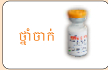
ថ្នាំចាក់