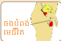
ចងបំពង់មេជីវិត