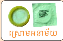
ស្រោមអនាម័យ