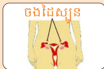
ចងដៃស្បូន