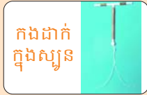
កងដាក់ក្នុងស្បូន