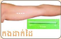
កងដាក់ដៃ